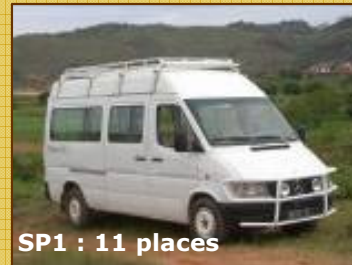
SP1 : 11 places