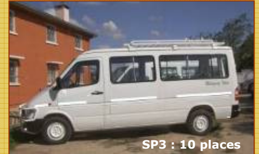
SP3 : 10 places