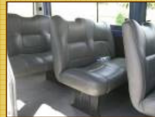
les Mercedes Sprinter