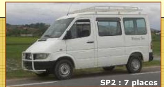
SP2 : 7 places