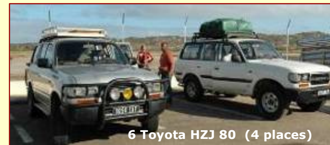
6 Toyota HZJ 80 (4 places)