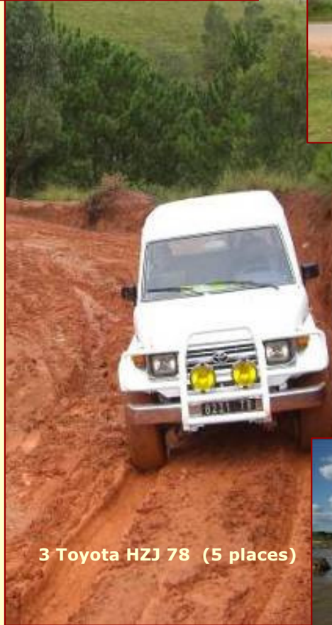
3 Toyota HZJ 78 (5 places)

Une équipe de mécano performants s'occupe, à Tana, de l'entretien de nos véhicules